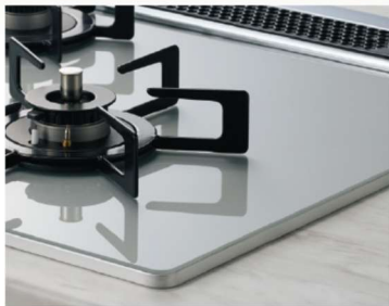
ラックリングごとく