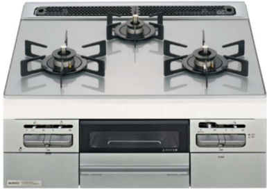
※バーナーキャップの色はブラックです。